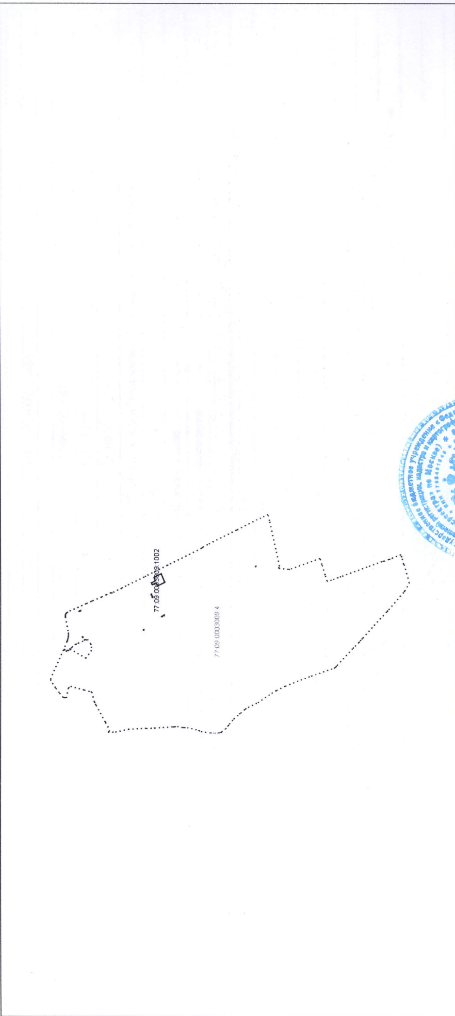
Схема расположения объекта недвижимости на земельном(ых) участке(ах):