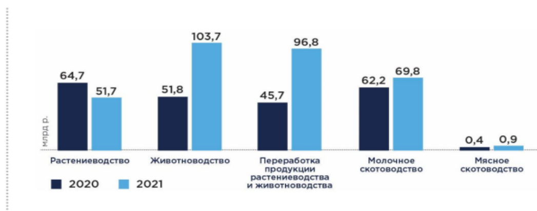
Рис.7. Сумма льготных инвестиционных кредитных договоров, млрд. руб.

Задание 4. Согласно рис. 1 в 2021 году российские аграрии стали кредитоваться наиболее активно по сравнению с предыдущим годом. Данная тенденция наблюдается и в первом полугодии 2022 года.