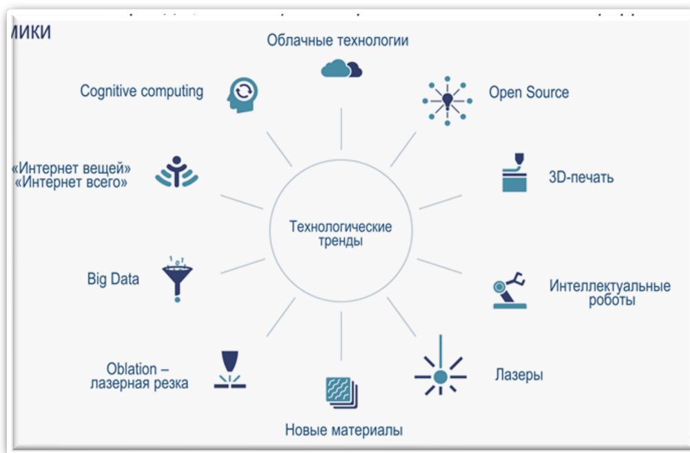
Рим. 1. Блоки цифровой экономики

Задание 28. Согласно рис. 2 «Блоки цифровой экономики», подобрать каждому элементу цифровой экономики соответствующие определение приведенное ниже.