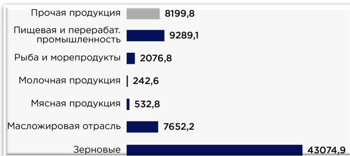
Рис. 1. Экспорт АПК РФ по отраслям на 01.01.2022, тыс.т.

Задание 23. Произвести анализ российского экспорта продукции отраслей АПК (табл.1) Таблица 1 – Положения российского экспорта отдельных товаров АПК в мировой торговле в 2021 году