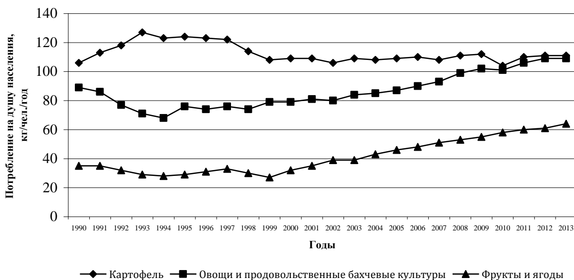
Рисунок 3.1 – Динамика изменения уровня потребления плодовоовощной продукции в России

При оформлении графиков оси (абсцисс и ординат) вычерчиваются сплошными линиями (рис.3.1).