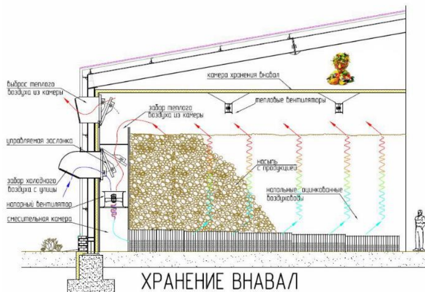
Рис. 3.1 Активное вентилирование картофеля при его навалном размещении в хранилище