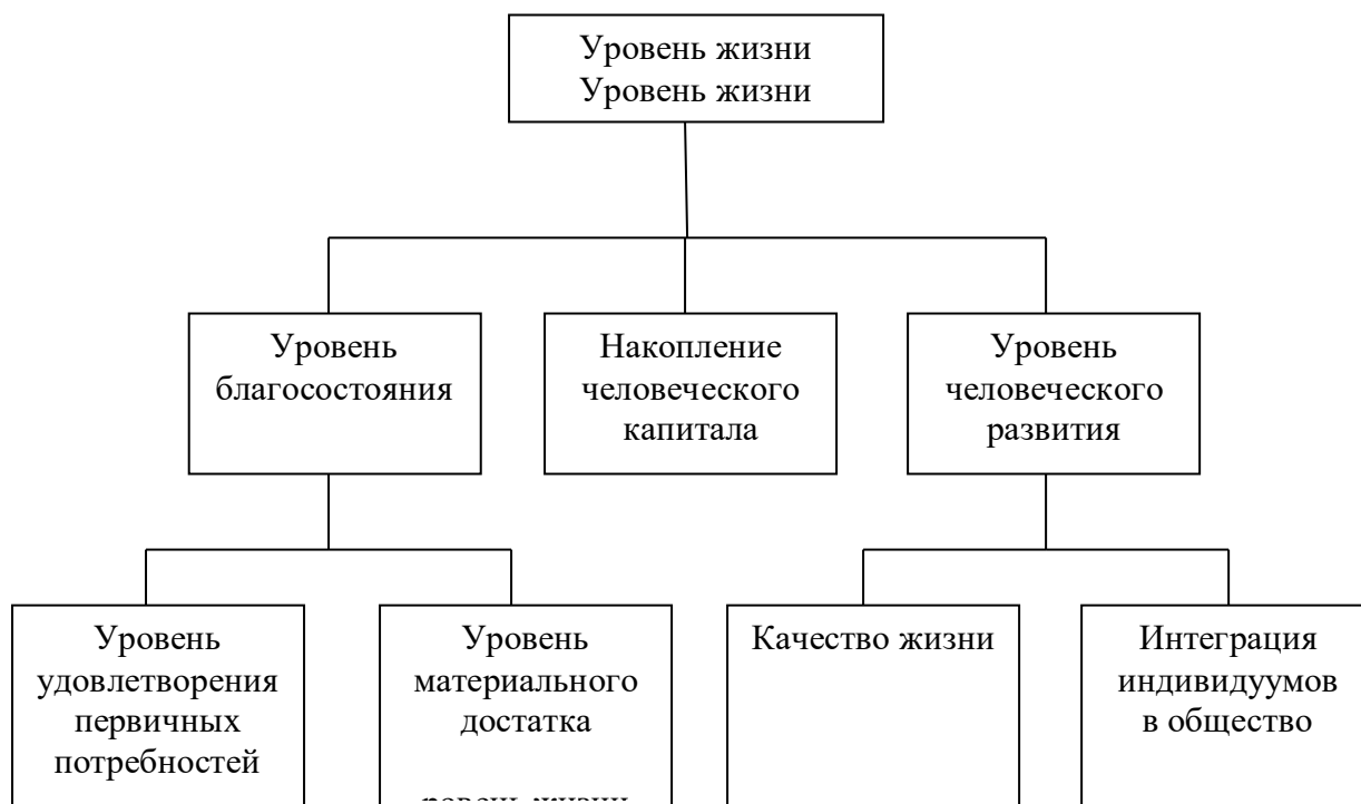
Рисунок 1 - Структура понятия уровня жизни населения

Структура термина «уровень жизни населения» представлена на рис.1.