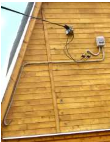
Рисунок 2 – Ввод проводов в здание

На всём пути электрического ввода от опоры к щитку, нельзя делать подсоединения и отводы. Электрический ввод в дом, производится путём прохождения вводного провода сквозь стену дома. Для того чтобы ввести кабель или провод в помещение, проделываются отверстия, в которые вделываются изоляционные трубки. На входе и выходе вводных проводов на сами эти трубки надевается резиновые или пластмассовые втулки. Трубки внутри же стены по возможности замазывают гипсом или алебастром.