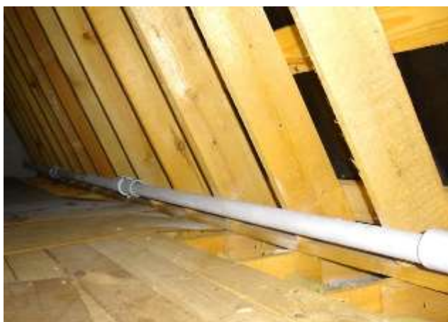
Рисунок 3–Ввод проводов в здание

На всём пути электрического ввода от опоры к щитку, нельзя делать подсоединения и отводы. Электрический ввод в дом, производится путём прохождения вводного провода сквозь стену дома. Для того чтобы ввести кабель или провод в помещение, проделываются отверстия, в которые вделываются изоляционные трубки. На входе и выходе вводных проводов на сами эти трубки надевается резиновые или пластмассовые втулки. Трубки внутри же стены по возможности замазывают гипсом или алебастром.