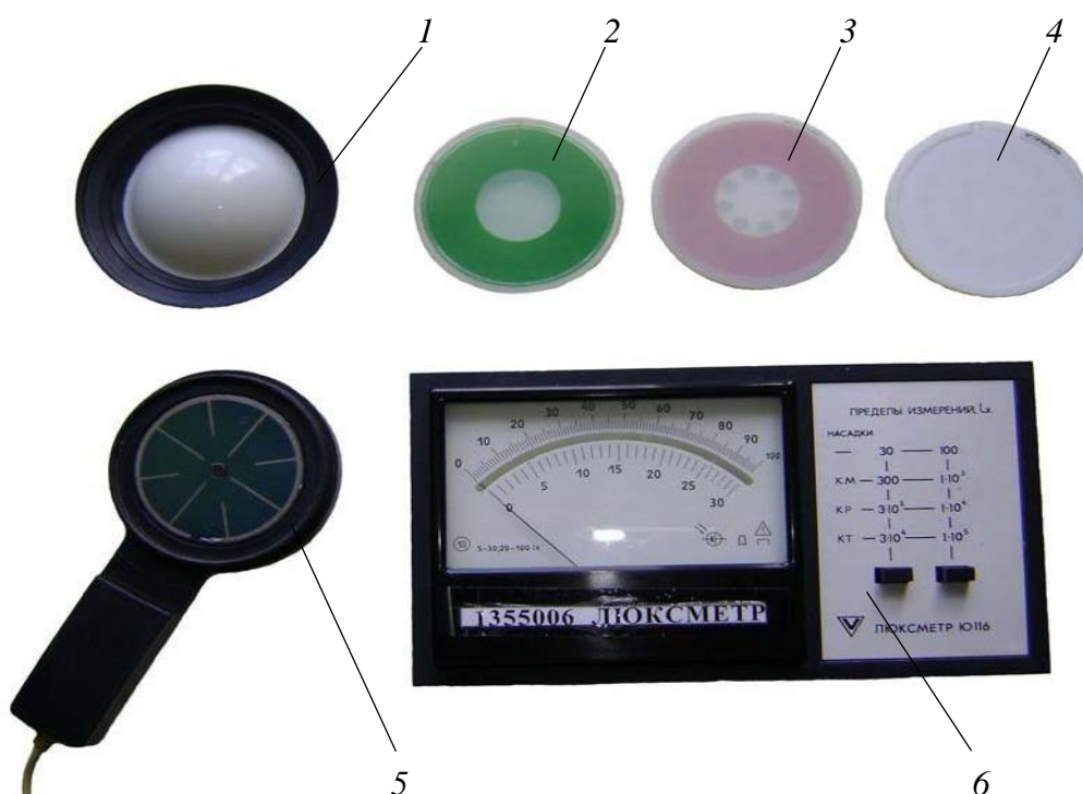
Рис. 2.3. Общий вид люксметра Ю-116: 1 – полусферическая насадка К; 2, 3, 4 – насадки с коэффициентами ослабления: М = 10, Р = 100, Т = 1000 соответственно; 5 – фотоэлемент; 6 – милливольтметр