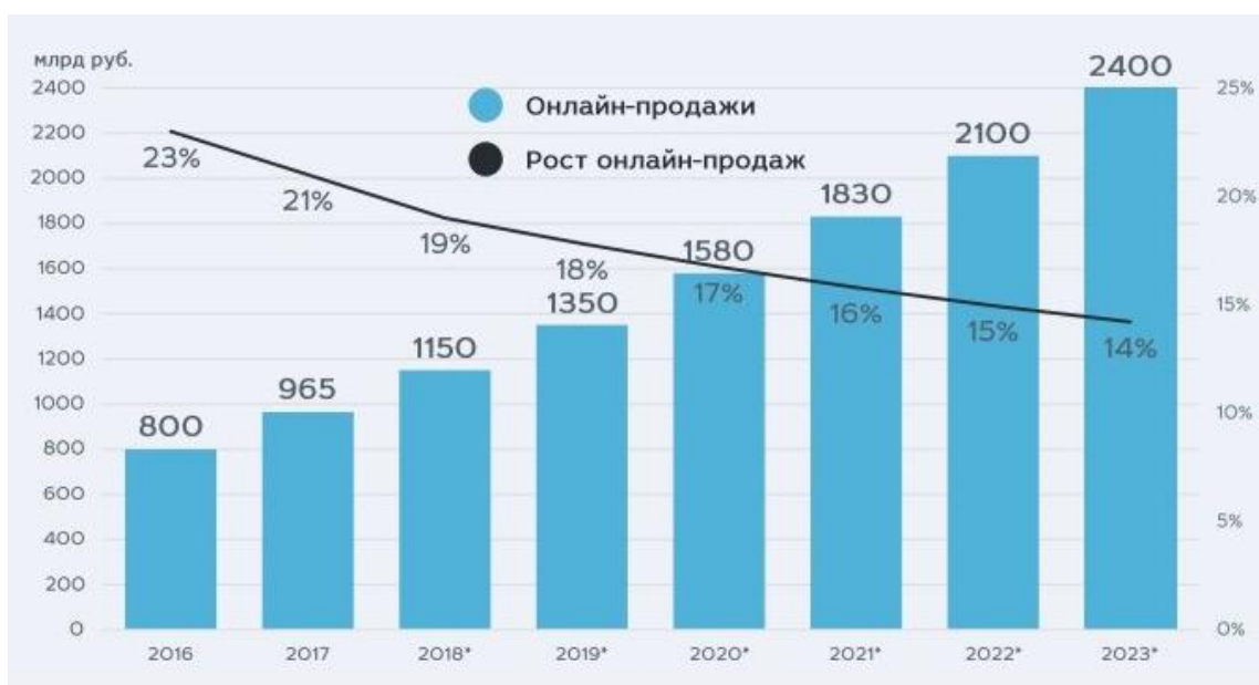
Рис. 3.1 Прогноз Интернет-торговли в России на 2019-2023 гг. (источник: Data Insight)

Схемы выполняют без соблюдения масштаба и пространственного расположения.