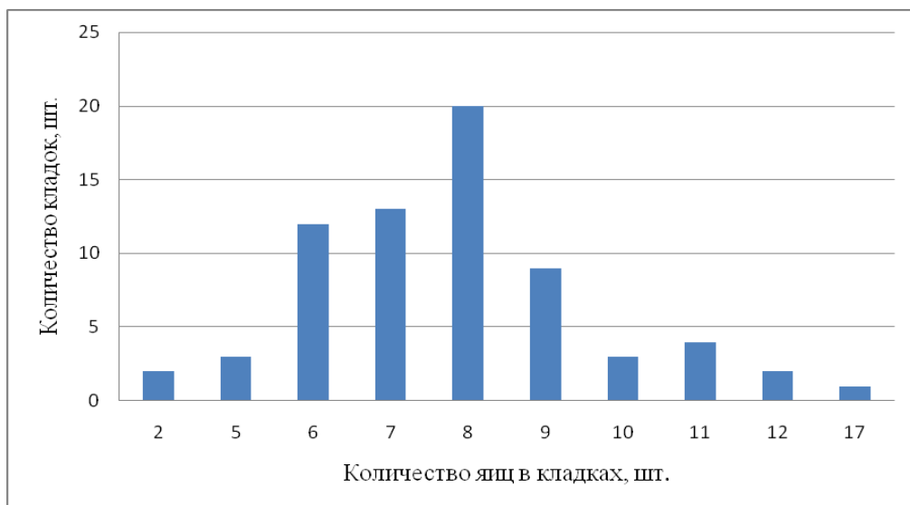
Рисунок 3.1 - Количество яиц в кладках восточной прыткой ящерицы в популяции Кумо-Манычской впадины

При оформлении графиков оси (абсцисс и ординат) вычерчиваются сплошными линиями. На концах координатных осей стрелок не ставят (рис.3.1). Числовые значения масштаба шкал осей координат пишут за пределами графика (левее оси ординат и ниже оси абсцисс). По осям координат должны быть указаны условные обозначения и размерности отложенных величин в принятых сокращениях. На графике следует писать только принятые в тексте условные буквенные обозначения. Надписи, относящиеся к кривым и точкам, оставляют только в тех случаях, когда их немного, и они являются краткими. Многословные надписи заменяют цифрами, а расшифровку приводят в подрисуночной подписи.