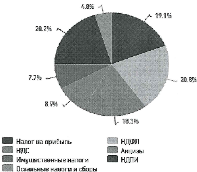
Рис. 2. Структура поступлений в консолидированный бюджет РФ в 2018 году

– либо командами ВСТАВКА-ОБЪЕКТ. При этом необходимо, чтобы объект, в котором создана вставляемая иллюстрация, поддерживался редактором Word стандартной конфигурации.