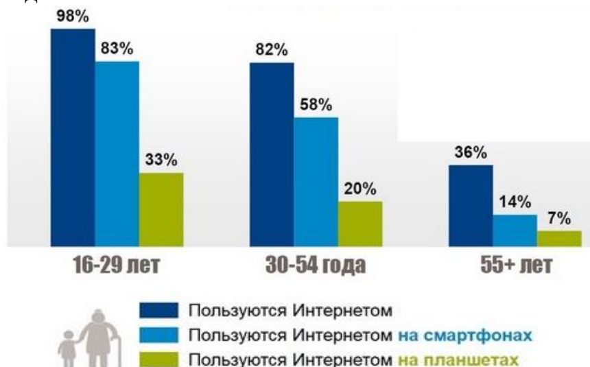
Рис. 3.1 Профиль пользователей Интернета на начало 2018 года

быть указаны условные обозначения и размерности отложенных величин в принятых сокращениях. На графике следует писать только принятые в тексте условные буквенные обозначения. Надписи, относящиеся к кривым и точкам, оставляют только в тех случаях, когда их немного, и они являются краткими. Многословные надписи заменяют цифрами, а расшифровку приводят в подписуночной подписи.