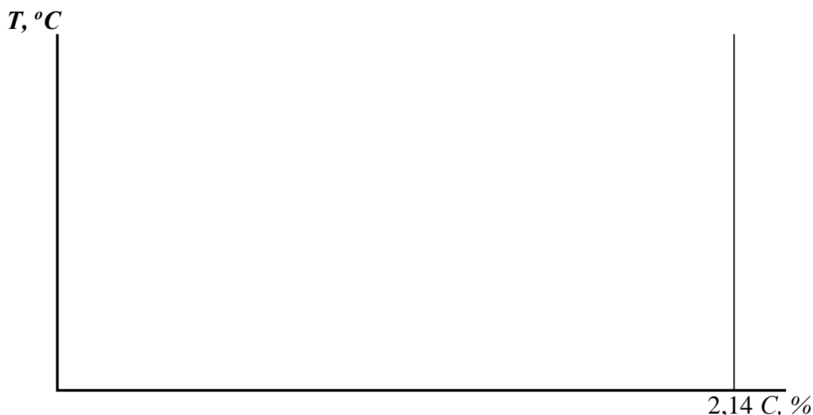
Схема термической обработки для всех выбранных операций Т.О. с указанием названия термообработок, температуры нагрева, охлаждающей среды и получаемой микроструктуры

Представить стальной участок диаграммы состояния железо-цементит, указать заданную марку стали (для ХТО – содержание углерода до и после, если применяется), температуру всех выбранных операций термической обработки.