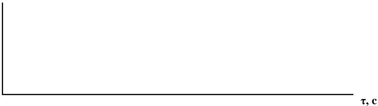
Схема микроструктуры стали и механические свойства в состоянии поставки (а) и после окончательной термической обработки (б)