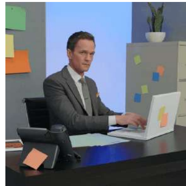
Клиент всегда пишем с большой буквы