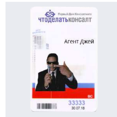
Неотъемлемый атрибут сотрудника