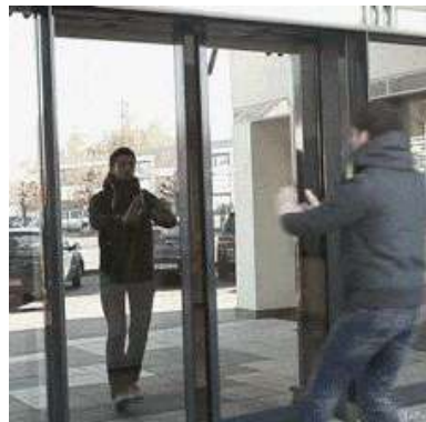
У нас входят без стука