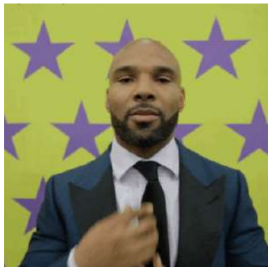
Офисный стиль одежды