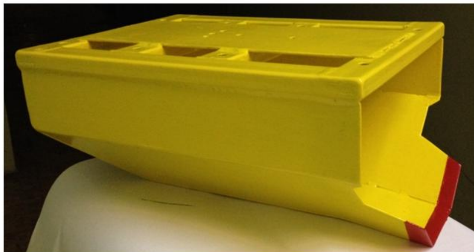
Модель ковша каналоочистителя PP-303 с трапецидальным профилем

Ведется работа по очередной модернизации рабочего оборудования, созданной на кафедре по линии ОНИЛ опытно-конструкторской машины PP-303М (русловой ремонтер).